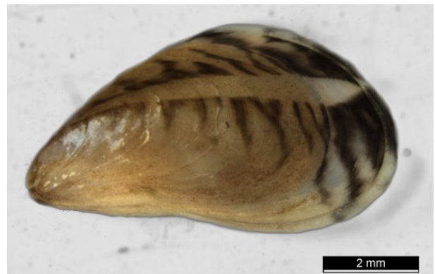
Figure 1 : Moule quagga

Elle peut mesurer jusqu'à 40 mm et vivre entre trois et cinq ans. Pour déterminer l'âge d'un individu de manière fiable, il convient, non pas d'observer sa taille, mais le nombre de stries de croissance présentes sur la valve. La croissance la plus importante a lieu au printemps et dépend de la température de l'eau, de la disponibilité des ressources en nutriments, de la teneur en oxygène et des courants.