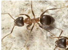
Lasius emerginatus / Zweifarbige Wegameise