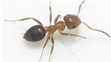
Lasius brunneus / Braune Hausameise

(die Gängigsten Arten, müssen nicht zwingend bekämpft werden)