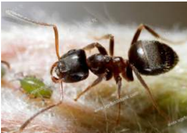
Lasius niger / Schwarze Wegameise

...natürlich gibt es noch viel mehr Arten, aber nicht alle sind Invasiv....darum ist es Wichtig die Ameisen genau bestimmen zu können.